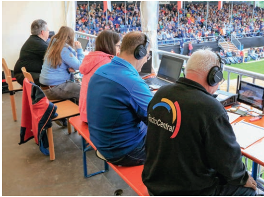
Radio Central berichtete live vom Schwingfest