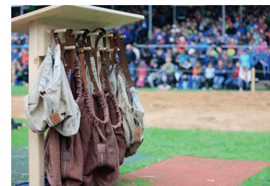
Schwinghosen in allen Grössen