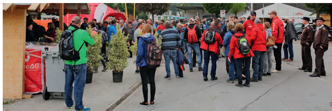
Sonntagmorgen, Anmarsch der Schwinger und Besucher

Am 20. April 2018, drei Wochen vor dem Festtag, lud das OK zum Sponsoren-Anlass in die Mehrzweckhalle Kägiswil ein. Neben Kulinarik wurde den Gästen ein abwechslungsreiches Unterhal-