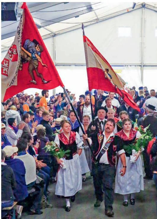
Einzug zur Siegerehrung