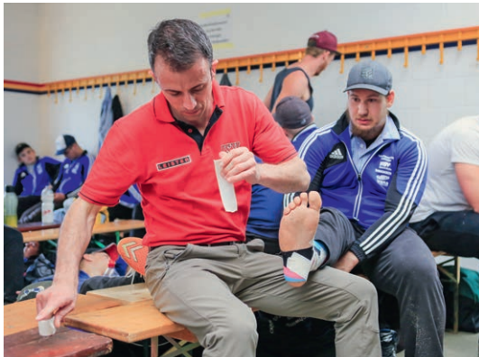
Erholung und Massage für die Schwinger während der Mittagspause