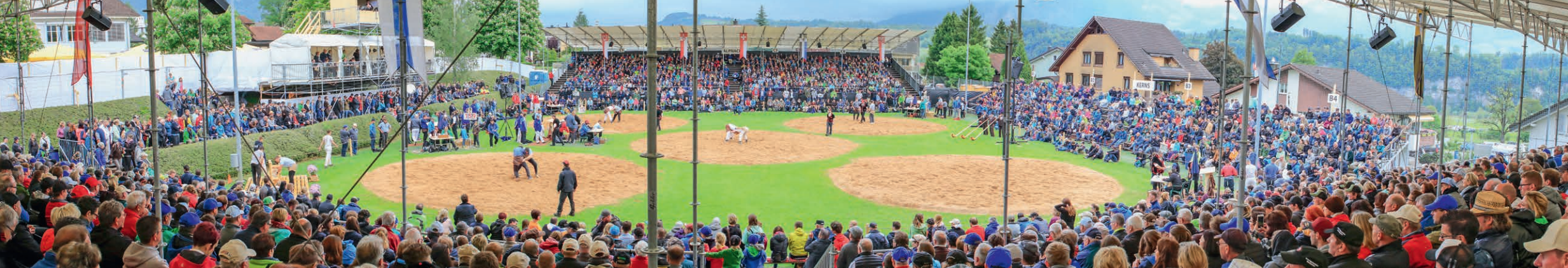
Prallgefüllte Schwingarena mit 4150 Zuschauern