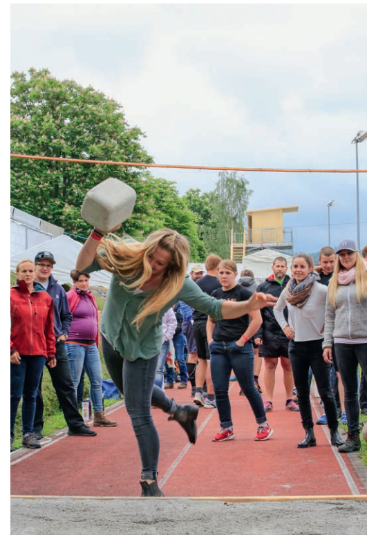
Auch die Frauen wagten sich ans Steinstossen

Bereits für den Sponsorenabend waren Dutzende Helfer notwendig, die beim Einrichten, Servieren und Aufräumen ihre Dienste erwiesen. Für den gesamten Anlass gelangten über 500 Helferinnen und Helfer zum Einsatz. Sie leisteten zusammen vor, während und nach dem Schwingfest über 5000 Arbeitsstunden. Die meisten Helferhände konnten über Vereine aus der Gemeinde Sarnen organisiert werden. Aber auch viele Einzelpersonen, darunter zahlreiche Pensionäre, ja sogar Asylsuchende unterstützten den Schwingeranlass mit grossem Elan. All diesen helfenden Händen gehört ein riesiges Dankeschön!